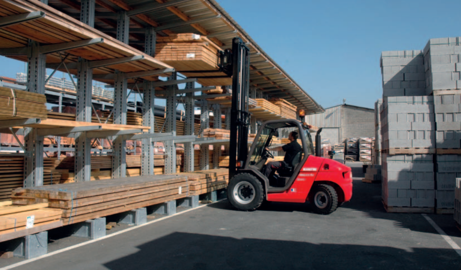
PRZEMYSŁ DRZEWNY //