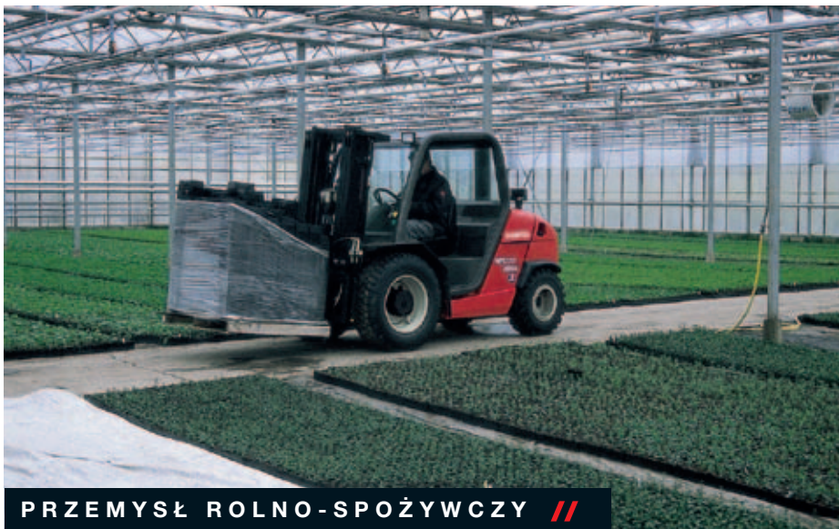
PRZEMYSŁ ROLNO-SPOŻYWCZY //